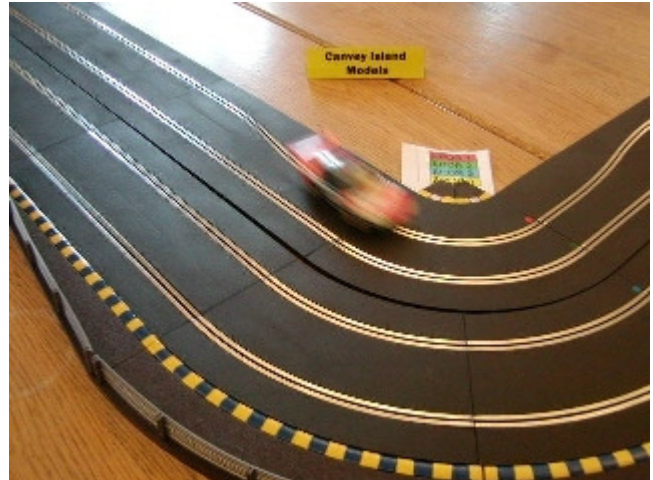
Porsche 911 GT3-R i Canvey Island Models svinge!

Det var nu tid til lidt frokost som blev indtaget ved Tulip pølsevognen på Rådhuspladsen eller et andet sted ned af Strøget.