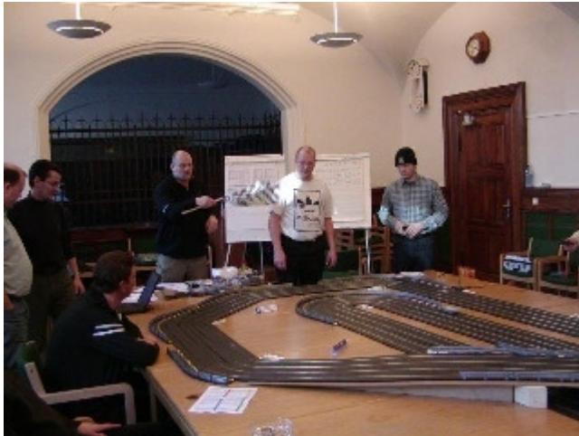
Jan flager fire timers race af.