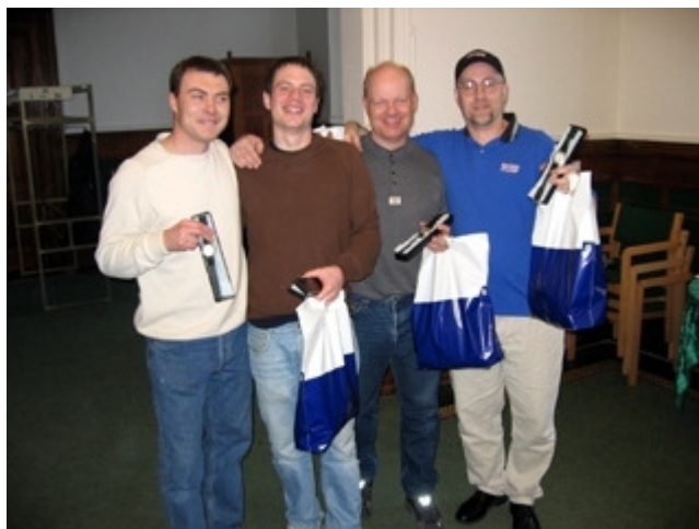
Palle fra Apropos a/s uddeler ure til de fire lykkelige vindere.