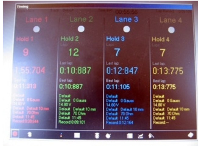
Team 2 er foran efter få minutters kørsel, men Team 3 vendte hurtigt billedet!