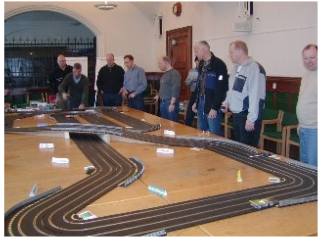
Banen fra den "sydlige" ende med flere sponsorskilte.