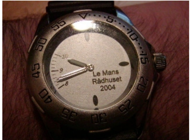
Sådan ser en vinders ur ud ! Sponsor: Apropos a/s

Tilbage er der blot at sige et stort tak til alle deltagerne og alle vores sponsorer som alle var med til at gøre det til en god dag og vi håber at vi må kontakte jer igen næsten gang vi finder på et arrangement.