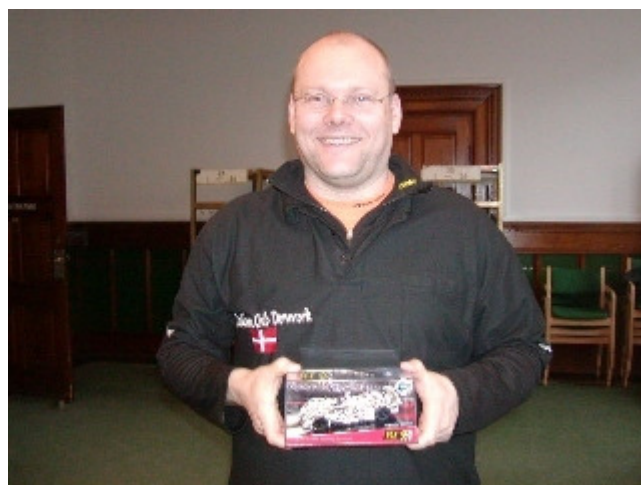
Jan - Dome S101 Judd Sponsor: Canvey Island Models