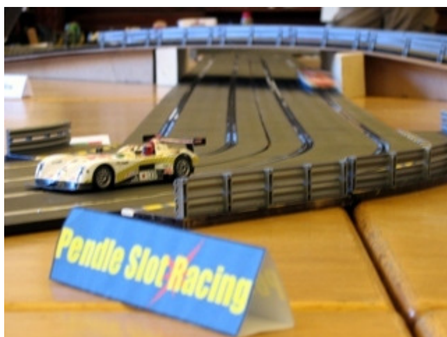
Panoz LMP-1 i Pendle Slot Racing svinget - skarpt forfulgt af Porsche 911 GT3-R.

13:30 blev løbet sat i gang igen og Team 3's Mikkel lagde ud med 43 omgange i spor 1, men Team 4's Michael T svarede igen med 43 omgange i spor 2 og de to teams fulgtes ad med skiftevis føringer og endte på 314 omgange hver, mens Team 1 kørte 297 omgange og Team 2 kørte 259 omgange. Den samlede stilling var nu at Team 3 lå på 946 omgange, Team 1 var på 909 omgange, Team 4 var på 874 omgange og Team 2 var på 854 omgange. Med en føring på 37 omgange kunne Team 3 næsten ikke sætte sejren over styr i den sidste time.