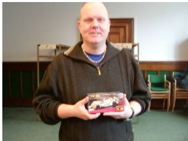
Steen - Dome S101 Judd Sponsor: Pendle Slot Racing, England

Vi havde fået sponsoreret fire biler og købt en ekstra bil for startgebyret og de fem biler trak vi så lod om blandt deltagerne samt et ekstra ur og en ekstra gevinst. De heldige vindere er følgende: