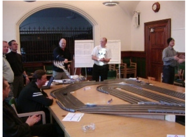
Stort bifald til kørerne og arrangementet

Efter en lille pause blev det nu tid til præmieoverrækkelsen som var et rent slaraffenland takket være vores sponsorer som virkelig havde været i det gavmilde hjørne.