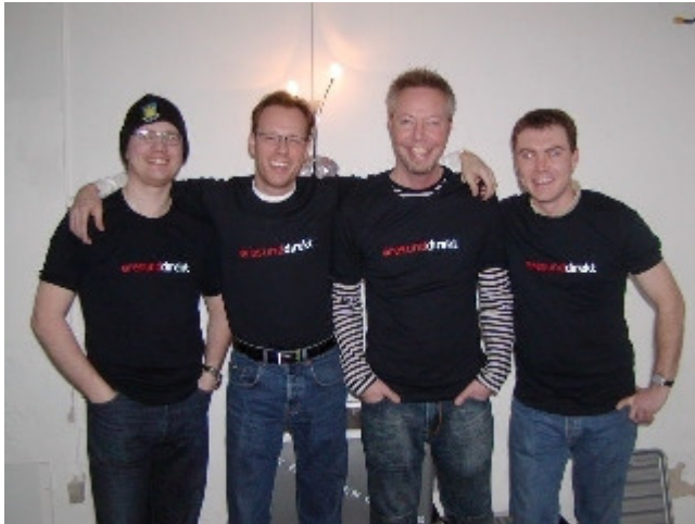
De fire holdkaptajner i deres Øresunddirekt t-shirts. Sponsor: Øresunddirekt