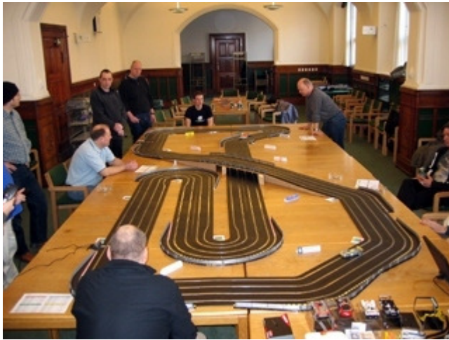
Banen fra den "nordlige" ende med alle sponsorskiltene omkring banen.