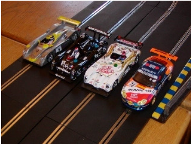
De fire biler som blev benyttet i 4 timers løbet .