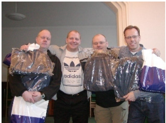
Team 1 smiler pænt, men er lidt skuffede og vil ikke se fotografen i øjnene ...